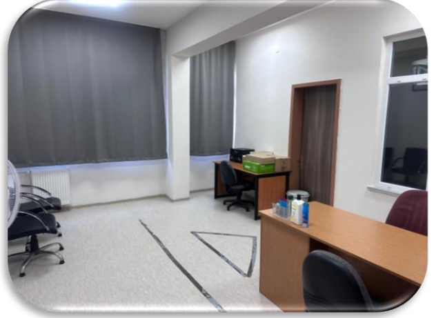
Psikolojik Ölçme (Test) Odası