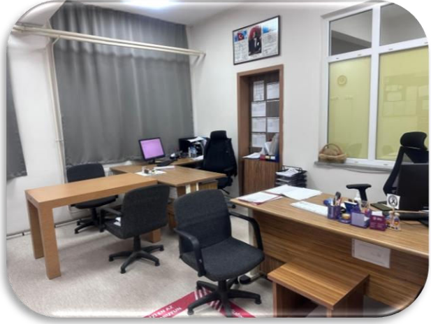
Özel Eğitim Hizmetleri Bölümü Odası