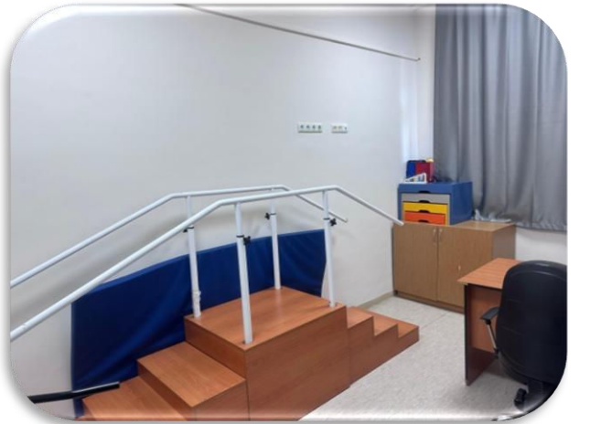
Bedensel Değerlendirme Odası 1