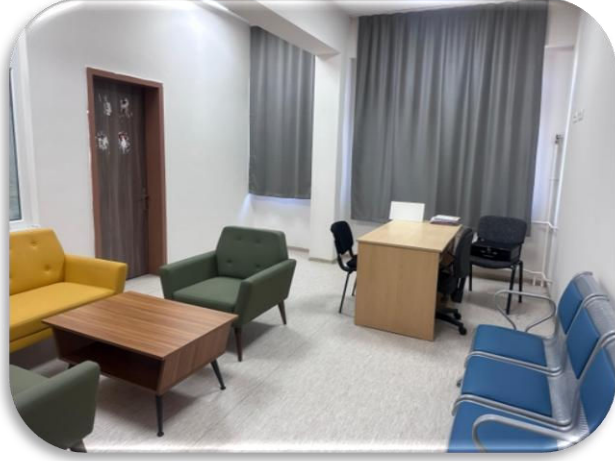
Psikolojik Danışma Odası