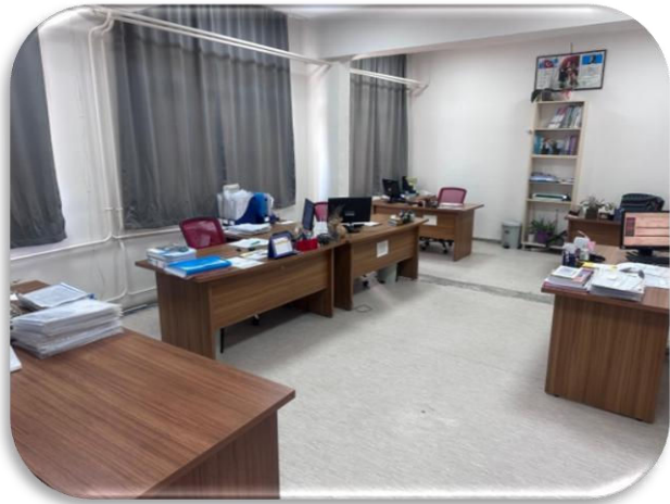
Uzmanlar Odası 1