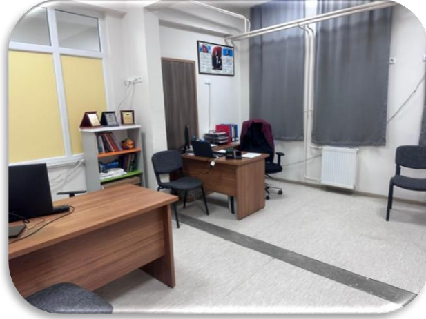
Rehberlik ve Psikolojik Danışmanlık Hizmetleri Bölümü Odası