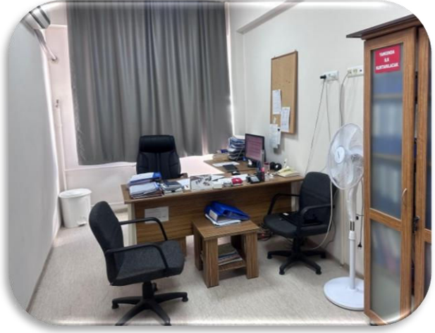
Müdür Yardımcısı Odası