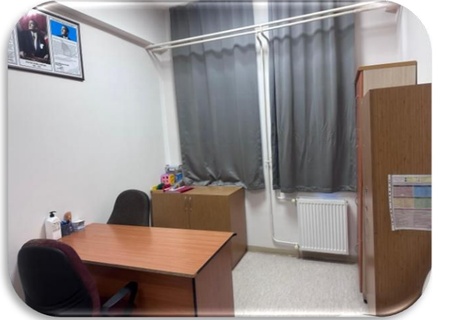
Bireysel Değerlendirme Odası 2