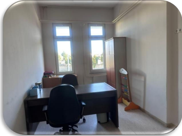
Bireysel Değerlendirme Odası 1