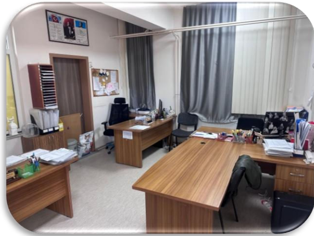
Uzmanlar Odası 2