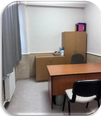
Bireysel Değerlendirme Odası 3