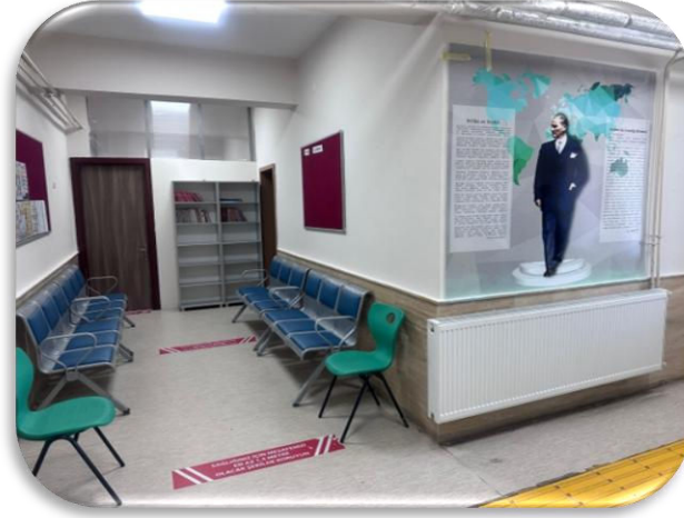
Veli Bekleme Odası