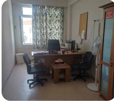
Müdür Yardımcısı Odası