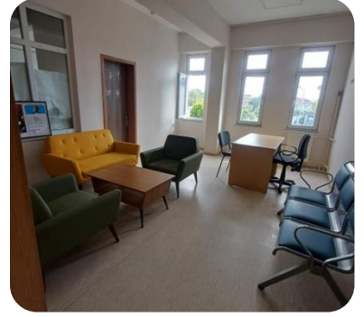
Psikolojik Danışma Odası