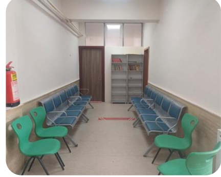
Veli Bekleme Salonu