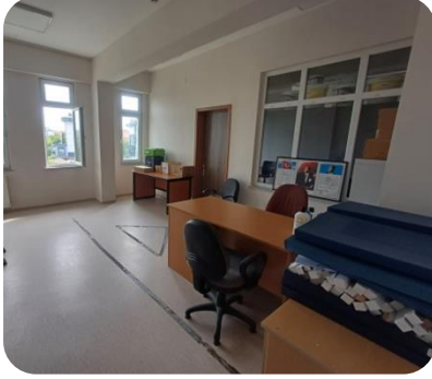
Psikolojik Ölçme (Test) Odası