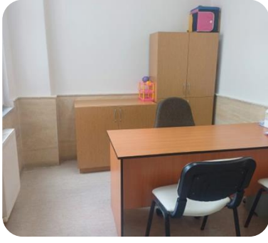
Bireysel Değerlendirme Odası