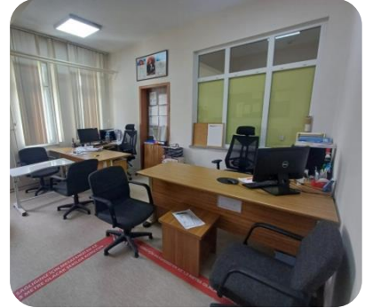
Bölüm Başkanları Odası